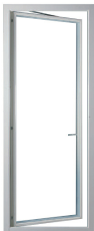
Utsida, helglasat utförande